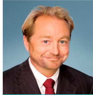
Kjell Inge Røkke Styremedlem