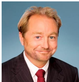
Kjell Inge Røkke Styremedlem